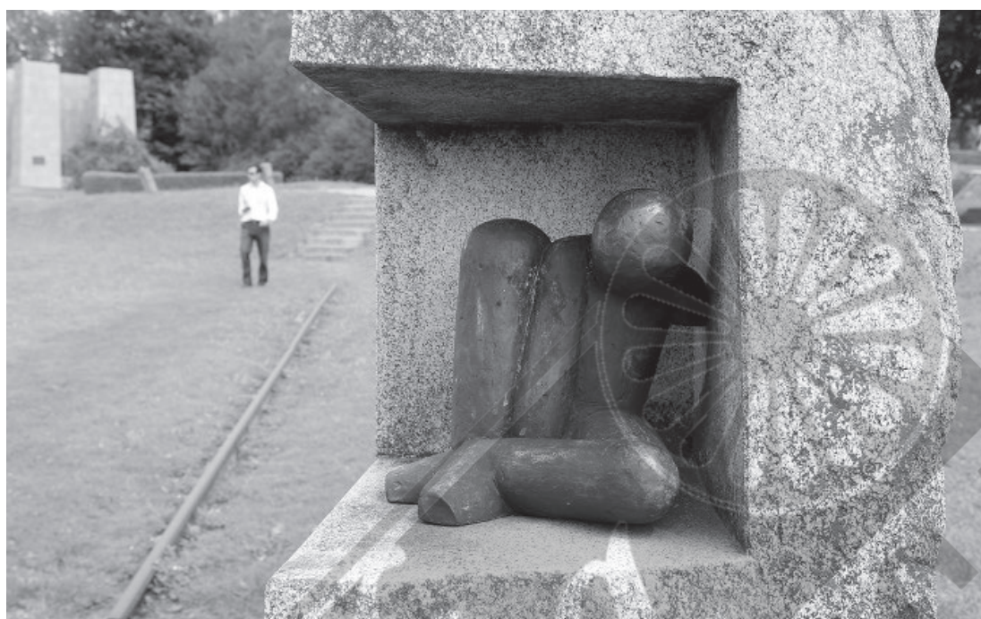
Pomnik ku czci romskich ofiar II wojny światowej w dawnym obozie w Mauthausen, Austria

mów. Przewodnik Bartosza znacznie jednak wykroczył poza zamierzenie wytyczenia szlaku w Małopolsce, bowiem w pierwszej części Autor opisał skrótowo wszystkie znane mu wówczas upamiętnione w Polsce miejsca, związane z zamordowaniem Cyganów w latach 1939–45 6 .