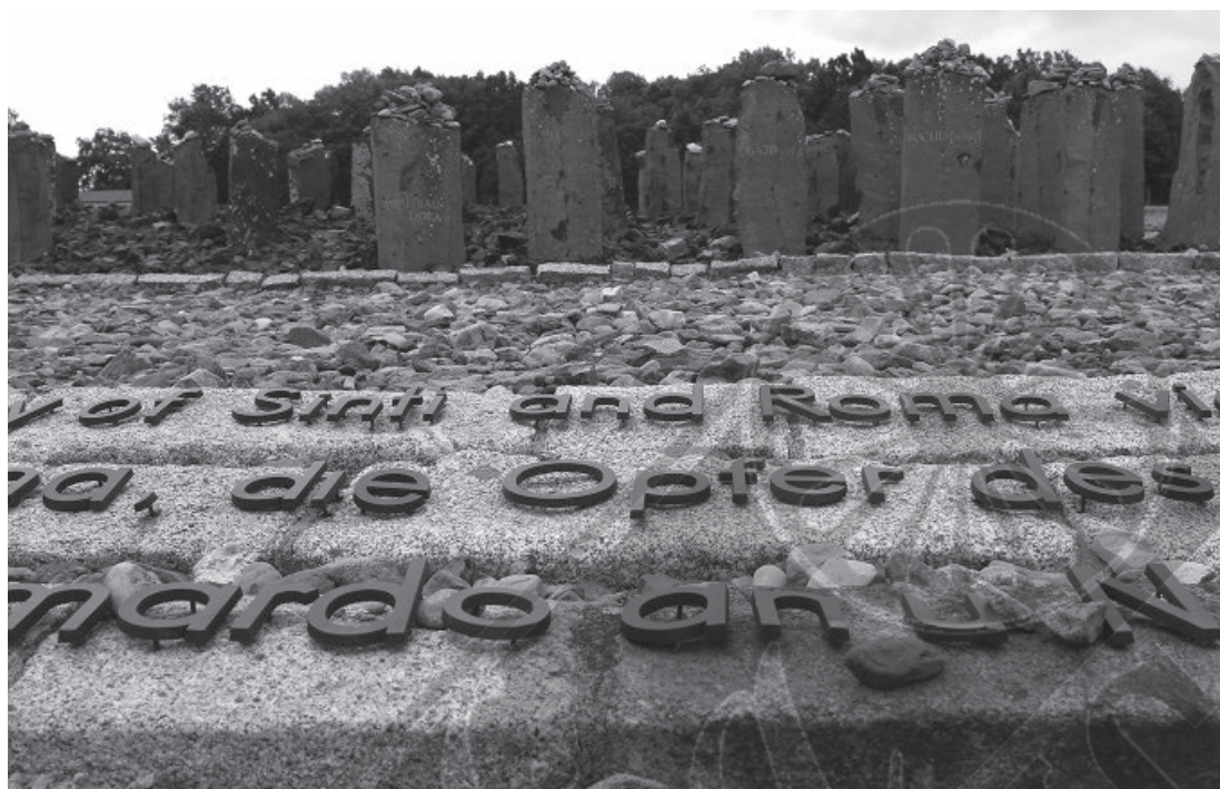
Pomnik ku czci romskich ofiar II wojny światowej w dawnym obozie Buchenwald, Weimar, Niemcy